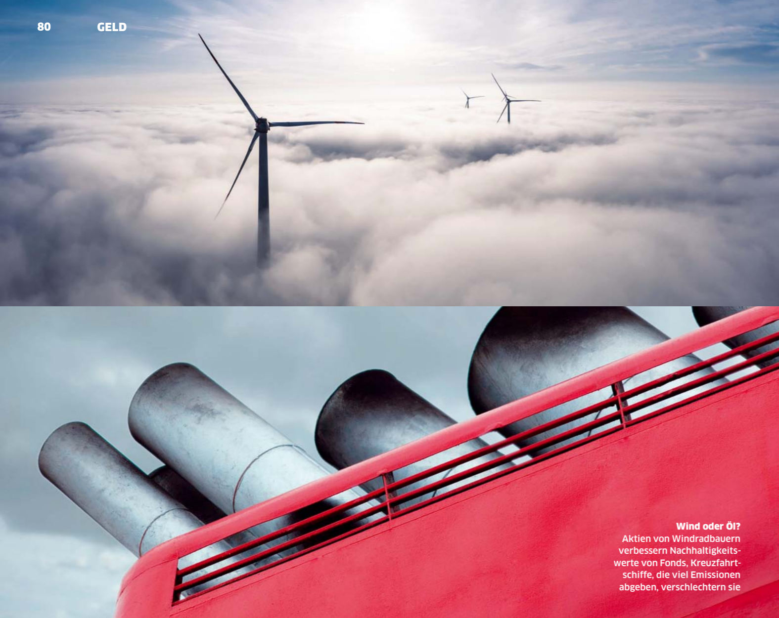
Wind oder Öl? Aktien von Windradbauern verbessern Nachhaltigkeitswerte von Fonds, Kreuzfahrtschiffe, die viel Emissionen abgeben, verschlechtern sie