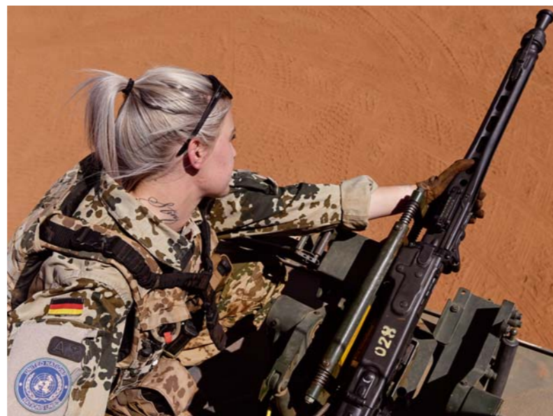
Auf der Abschussliste Rheinmetall liefert der Bundeswehr Sturmgewehre. Die Aktie bringt Nachhaltigkeitsfonds im Ranking Minuspunkte

zu erzielen. Der Spitzenreiter in der Kategorie offensiv&flexibel namens FUNDament Total Return überzeugt mit einem sehr niedrigen maximalen Verlust von nur 5,5 Prozent, für jeden denkbaren Ein- und Ausstiegstag in den vergangenen drei Jahren. Der Fonds ist nicht ausdrücklich als nachhaltig gekennzeichnet und erreicht in dieser Wertung auch nur die Mindestpunktzahl von 70. Am Stichtag 30. Juni hielt er mit geringem Anteil auch den Rüstungshersteller Rheinmetall und Ölkonzern BP.