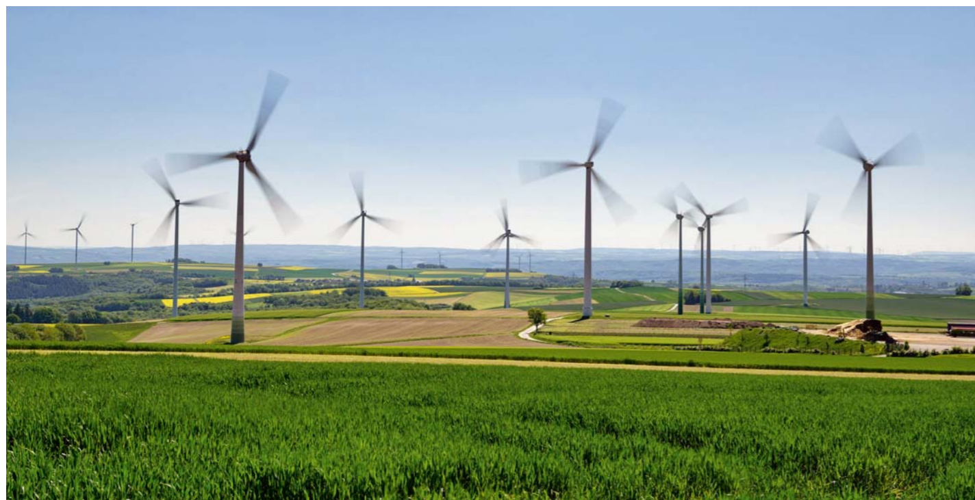
Erneuerbarer Gewinn Windräder von Vestas drehen sich im Windpark von Clearvise bei Dungenheim. Mit beiden Aktien können Nachhaltigkeitsfonds im Ranking punkten